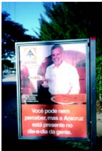
Foto 1: outdoor em Vitória da última campanha da Aracruz em relação à geração de emprego

O Jornal A Gazeta 2 é o principal jornal de circulação diária no Estado do Espírito Santo. Neste Jornal, a Aracruz encontrou seu mais fiel parceiro na imprensa estadual. A Gazeta só divulga notícias positivas da empresa e sempre minimiza os protestos ou críticas. O compromisso deste jornal com a Aracruz se baseia na sua convicção de que os grandes projetos econômicos são fundamentais para o desenvolvimento do Estado. A empresa, por sua vez, veicula constantemente através deste jornal uma grande quantidade de anúncios publicitários, incluindo cadernos especiais. Provavelmente tudo isso deve influenciar nas opiniões do jornal. O resultado é uma verdadeira manipulação da opinião pública através todos os meios de comunicação ligados à Rede Gazeta, não apenas o Jornal, mas também a televisão e o rádio. Todas as tentativas de divulgação de atividades e ações da Rede Alerta contra o Deserto Verde, ou os impactos negativos causados pela Aracruz Celulose, não alcançam sucesso.