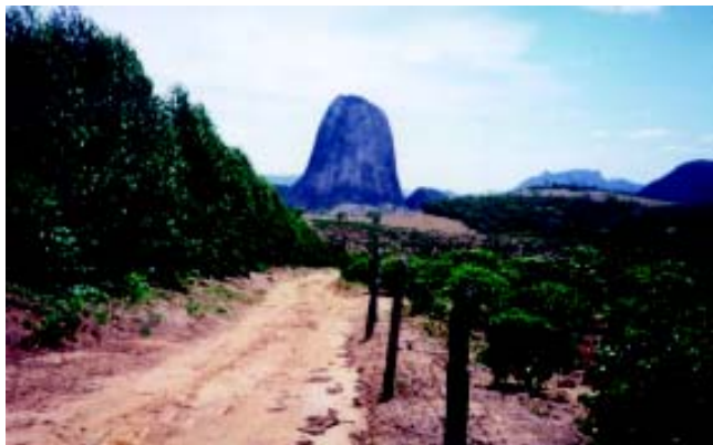
Foto 2: fazenda em São Gabriel da Palha onde os dois trabalhadores da Emflora foram intoxicados

desses trabalhadores. Eles foram levados ao médico da empresa, que pediu que voltassem imediatamente ao trabalho, afirmando que estavam bem e que iriam se acostumar ao trabalho com agrotóxicos. Na verdade, os dois estavam com leucopenia, o que foi constatado por exames realizados na capital do estado, Vitória.