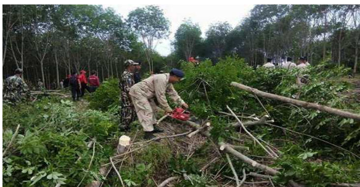
Funcionarios públicos eliminan árboles de caucho de los pobladores

Los funcionarios estatales justifican estas acciones e intimidan a la población rural, en la que están enfocados, aduciendo que los pobladores son en realidad capitalistas o están respaldados por grandes empresas.