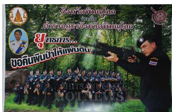
Un afiche estatal de relaciones públicas de la provincia de Phitsanuloke: “devolver los bosques al país”.

Entre 2014 y 2019 se presentaron unos 46.600 casos contra pobladores por invasión del bosque. En los tribunales de Chaiyaphum, por ejemplo, utilizando la Ley de Parques Nacionales, numerosos pobladores fueron encarcelados, expulsados de sus tierras, y confrontados con gravámenes aplicados por daños y perjuicios.