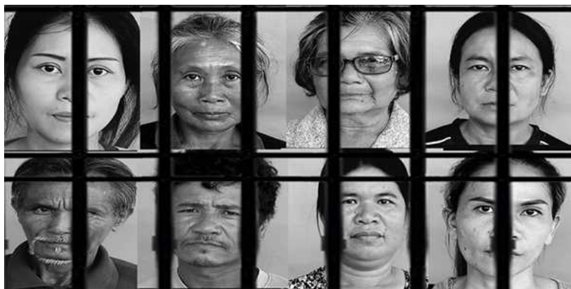
Comuneros demandados por traspasar el Parque Nacional Sai Thong en la provincia de Chaiyaphum, el tribunal decide encarcelarlos y les obliga a pagar daños al estado.

Disponible en tailandés: กฎหมาย อาชญากรรม และการตัดไม้ทำลายป่าในพื้นที่ชนบทของไทย