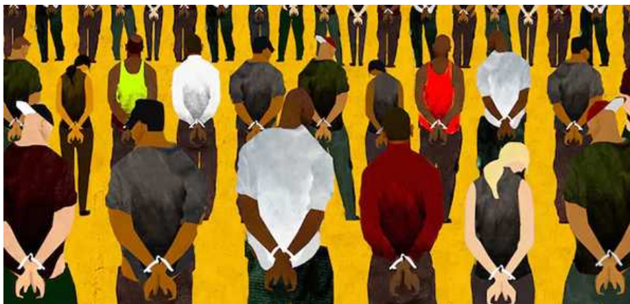
Ilustración: Brian Stauffer, Human Rights Watch

¿Qué es un crimen ? Según el diccionario, un crimen o delito es un acto ilegal por el cual alguien puede ser castigado por la autoridad gubernamental. Pero, entonces, ¿qué se considera un ‘acto ilegal’? ¿Y quién decide esto?