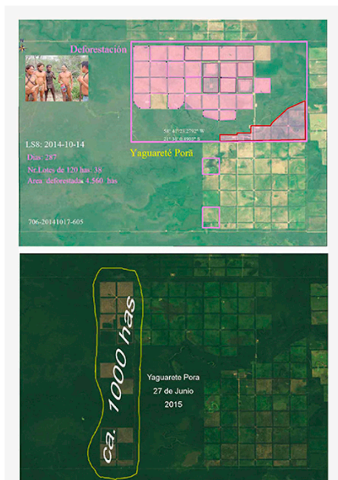
Últimas imágenes satelitales que muestran la reciente deforestación ilegal llevada a cabo por Yaguareté Porã en la tierra ancestral ayoreo. Datan del 27 de Junio de 2015.

Yaguareté Porã S.A., propiedad de Marcelo Bastos Ferraz, ocupa 78.549 hectáreas de tierra ayoreo, de las cuales miles ya han sido clareadas irregularmente por los trabajadores de la compañía. El ganadero brasileño despreció hace poco más de un año la petición desesperada de los ayoreos para frenar la destrucción a gran escala de su bosque (12), considerado patrimonio natural de la UNESCO. Imágenes satelitales tomadas el 27 de junio de este año dan fe de cómo, a pesar de no contar con la licencia medioambiental requerida, la frenética deforestación para dar paso a la actividad ganadera continúa. Se han hecho campañas de incidencia durante años para que Ferraz regrese su tierra a los ayoreos, pero aún se resiste a ello.